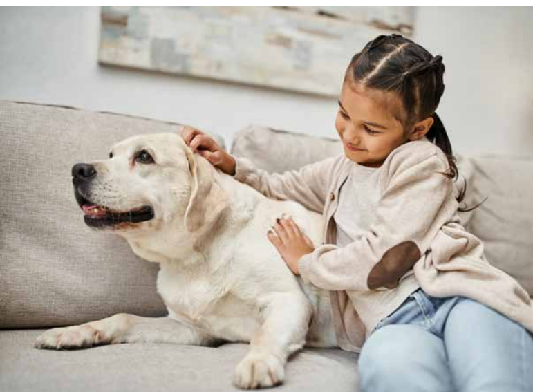
Nähe ist nicht gleich Nähe: entscheidend ist, ob der Hund eingeeengt wird – oder ausweichen kann.

REGINA RÖTTGEN ist freie Journalistin und hat sich auf die Themen Natur und Tiere spezialisiert.